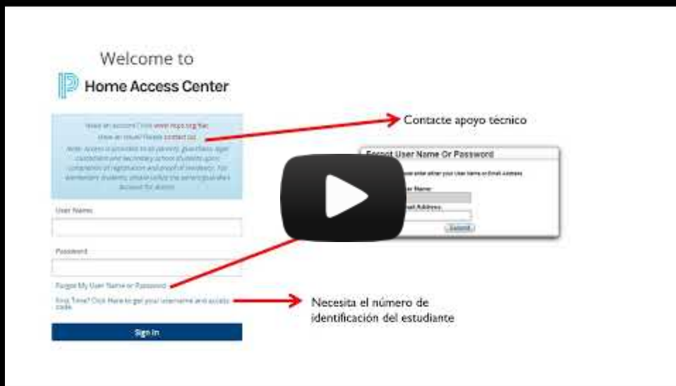
Spanish HAC video 2